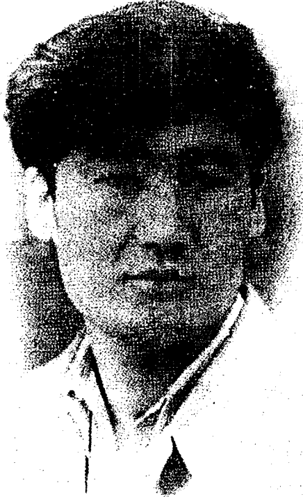
جالالدين بهرام 1962-يىل