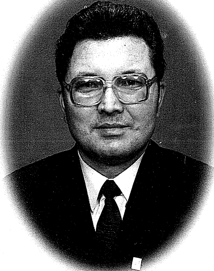
ئاپتونىمىڭ يېقىنقى سۈرىتى