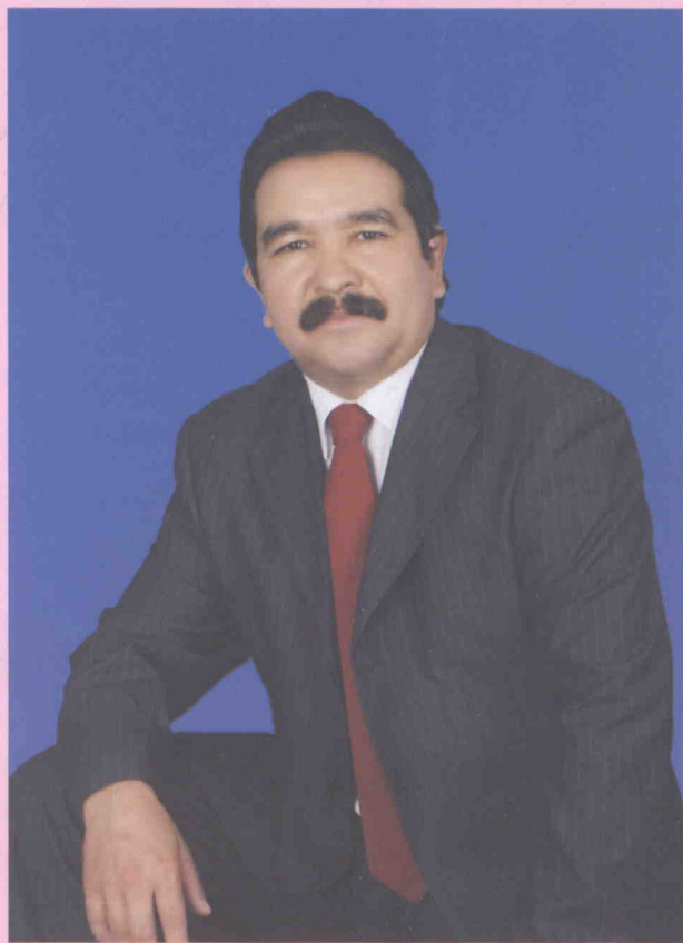
ئابدۇناسىر يۇنۇس ياۋايى