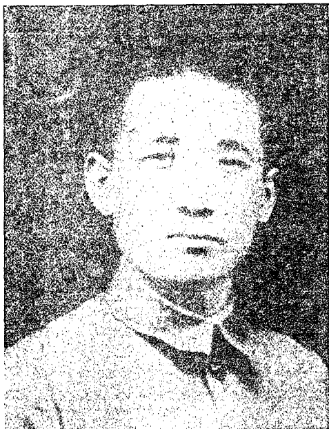
2 - رەسىم: جاڭ جۇجۇڭنىڭ 1932 - يىلى 28 - يانۋار ياپۇنغا قارشى ئۇرۇش مەزگىلىدە چۈشكەن رەسىمى.