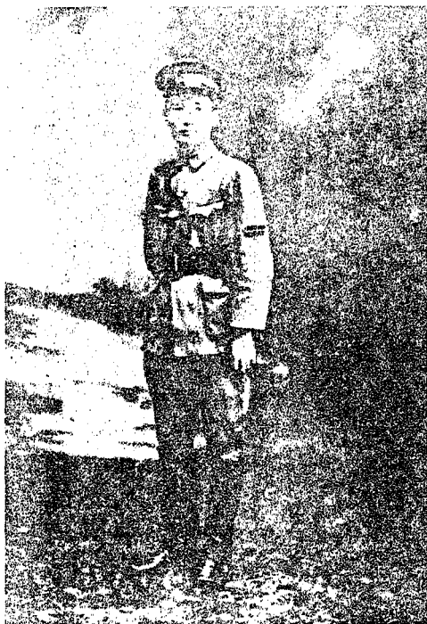
1- رەسىم: 1924- يىلى جاڭ جۇجۇڭنىڭ خۇاڭپۇ ھەربىي مەكتىپىدە مەسئۇل ۋەزىپىدە تۇرۇۋاتقان ۋاقتى.