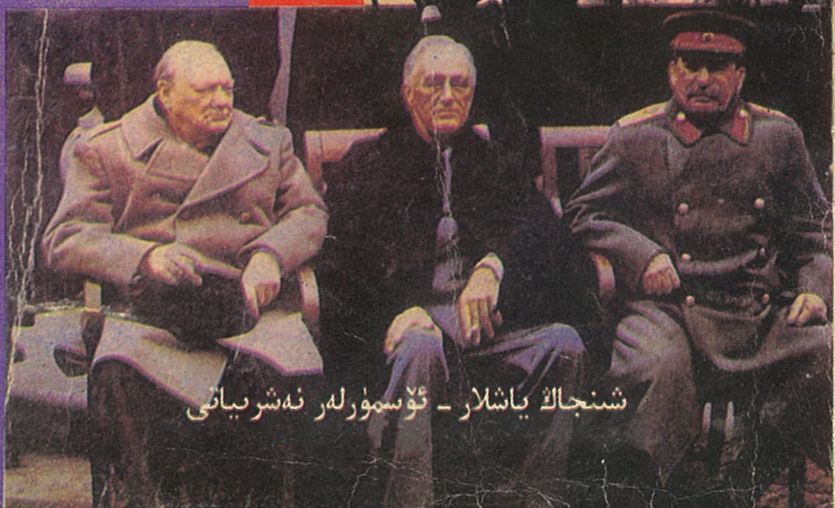
شىنجاڭ ياشلار - ئۆسمۈرلەر نەشرىياتى